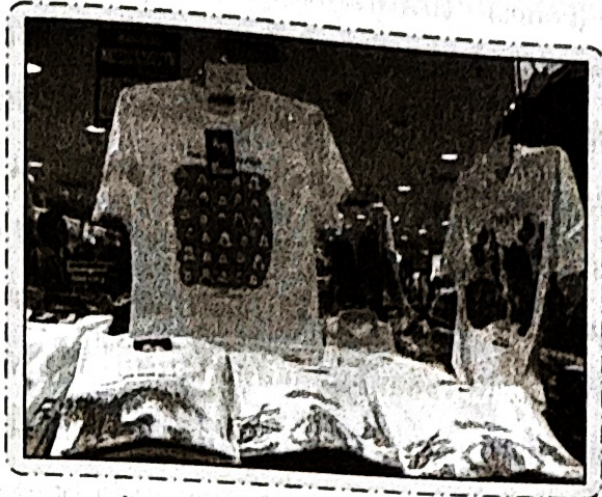
การนำขาดังต่อเข้ากับแกนรูปป่าทำให้แกนรูปป่าสูงขึ้น

1.2 หุ่นโชว์ (Mannequins) เป็นอุปกรณ์ที่แสดงลักษณะการใช้งานของสินค้าได้ดีที่สุดและถือว่าเป็นอุปกรณ์ที่มีราคาแพง หุ่นโชว์มีทั้งทำมาจากพลาสติก ปูนปลาสเตอร์ ยาง หรือไฟเบอร์กลาสส์ หุ่นโชว์มีหลายลักษณะ ได้แก่