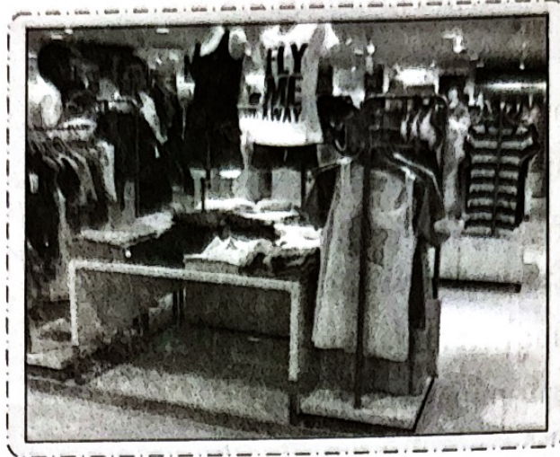
วัสดุอุปกรณ์ในการจัดแสดงที่ลูกค้าสามารถหยิบสินค้าได้ง่าย