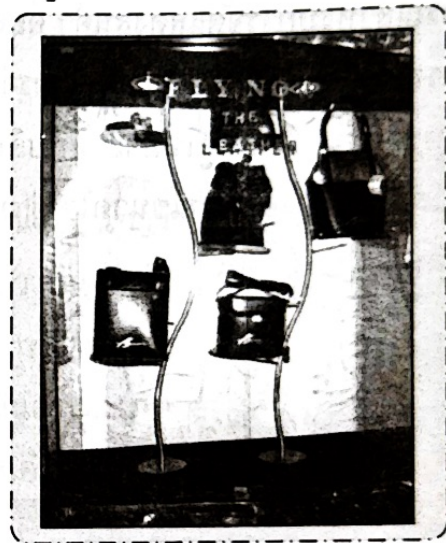
วัสดุอุปกรณ์ต้องไม่ดึงดูความสนใจไปจากตัวสินค้า

การจัดแสดงสินค้าต้องมีจุดเด่นที่สำคัญเพียงจุดเดียว คือ ตัวสินค้า ดังนั้น เมื่อต้องใช้วัสดุอุปกรณ์ตกแต่งการจัดแสดงสินค้าควรเลือกใช้ที่ไม่เด่น สะดุดตาเกินไปกว่าสินค้า ต้องระลึกเสมอว่า วัสดุอุปกรณ์เหล่านั้นเป็นเพียงส่วนประกอบของการจัดแสดงสินค้าเท่านั้น หากเด่นกว่าตัวสินค้า การจัดแสดงสินค้านั้นก็หมดความหมาย ไม่คุ้มค่ากับการลงทุน