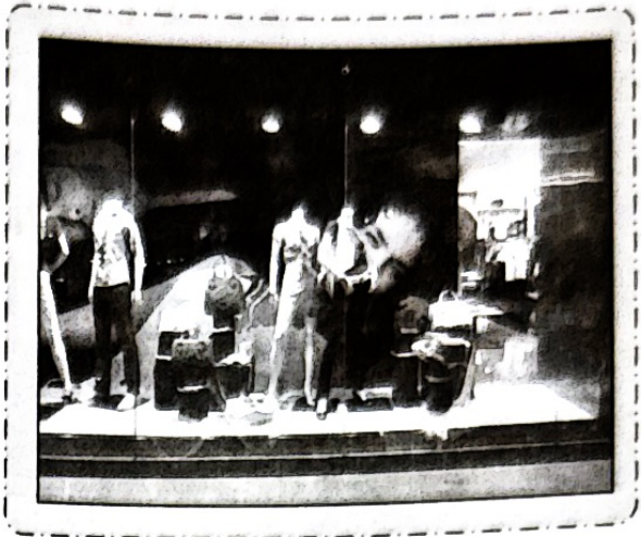
เลือกใช้วัสดุอุปกรณ์เหมาะสมกับกลุ่มเป้าหมาย

ร้านค้าปลีกแต่ละร้านจะมีลักษณะของกลุ่มลูกค้าเป้าหมายที่แตกต่างกันออกไป ร้านค้าที่มุ่งเจาะกลุ่มเป้าหมายระดับสูง หรือผู้ที่มีรายได้สูง ย่อมต้องเลือกใช้วัสดุอุปกรณ์ที่ดูหรูหรา มีคุณค่า เหมาะกับลูกค้า ในทางตรงกันข้าม หากกลุ่มลูกค้าเป้าหมายอยู่ในระดับกลางลงมา วัสดุที่เลือกใช้ต้องไม่ดูหรูหรามากนัก เพราะนอกจากจะเป็นการสิ้นเปลืองแล้ว ยังไม่เหมาะกับคุณสมบัติของร้านค้า และยังทำให้ลูกค้ามีความรู้สึกว่าร้านค้าไม่เหมาะกับตนเองอีกด้วย