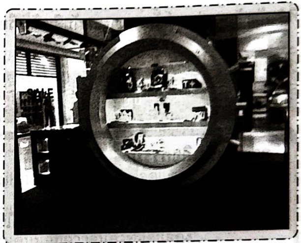
อุปกรณ์การจัดแสดงที่ช่วยป้องกัน เก็บรักษาสินค้า

สินค้าที่มีคุณค่า ราคาสูง ต้องใช้อุปกรณ์ที่ได้รับการออกแบบเป็นพิเศษ ที่มีความแข็งแรง ทนทาน สามารถจัดเก็บสินค้าได้ด้วยความปลอดภัย ทั้งจากการกระแทกและการถูกขโมย นอกจากนี้สินค้าประเภทอาหารสด น้ำอัดลม ไอศกรีม เค้ก นม ต้องเก็บไว้ในตู้ที่สามารถปรับอุณหภูมิให้ร้อน-เย็นตามต้องการ ดังนั้นในปัจจุบันจึงได้มีการออกแบบตู้ที่อำนวยความสะดวก ทั้งดึงดูดความสนใจผู้ที่ผ่านมา และสามารถเก็บรักษาสินค้าได้ด้วย