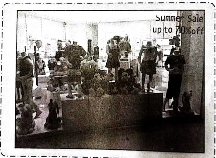
การนำแท่นมาใช้เป็นวัสดุอุปกรณ์ในการจัดแสดงสินค้า

2.1 แท่นและโต๊ะ (Pedestals and Table) ประโยชน์ของแท่นและโต๊ะคือ ช่วยทำให้สินค้าสูงขึ้น เด่นขึ้น ทำให้สินค้าดูมีชีวิตร่าซิว สินค้าประเภทหมวก รองเท้า มักนิยมใช้การจัดวางบนแท่น สิ่งสำคัญในการเลือกโต๊ะและแท่นมาใช้เป็นอุปกรณ์ประกอบคือ ต้องเลือกระดับความสูงที่เหมาะสม ให้อยู่ในระดับสายตาของลูกค้าที่จะสามารถมองเห็นได้เป็นอย่างดี