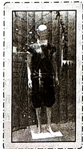
หุ่นโชว์ทั้งตัว