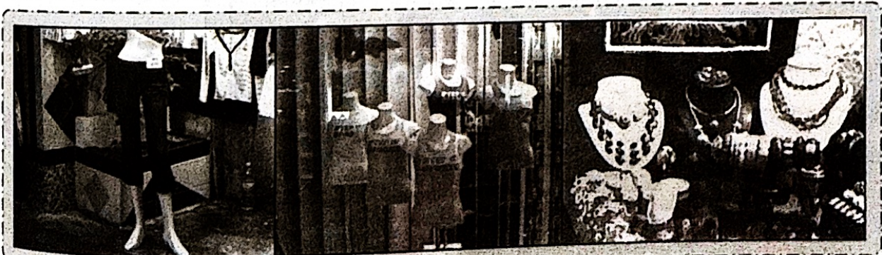
หุ่นโชว์เฉพาะส่วน