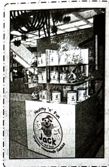
วัสดุอุปกรณ์ต้องเหมาะสมกับสินค้า

สิ่งที่ต้องคำนึงถึงอีกอย่างหนึ่งในการเลือกวัสดุอุปกรณ์สำหรับการจัดแสดงสินค้า คือความเหมาะสมระหว่างวัสดุอุปกรณ์กับสินค้า วัสดุอุปกรณ์ในการจัดแสดง ควรเลือกที่มีขนาด รูปแบบ รูปทรง สี สันที่ เหมาะสมกับสินค้า เช่น ถ้าสินค้ามีขนาดเล็กแล้วเลือกใช้อุปกรณ์ขนาดใหญ่ จะทำให้ความโดดเด่นของสินค้าหมดไป เป็นต้น